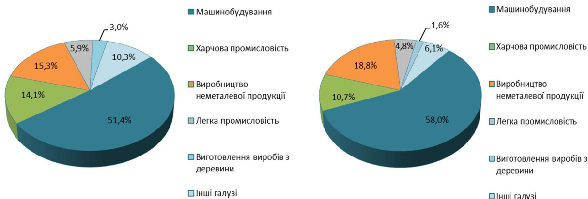
Малюнок 1.1. Структура промисловості м. Коломиї за обсягами виробництва промислової продукції у 2018 році (зліва) та січні-листопад 2019 року (справа), %

Основними видами галузями є виробництво харчових продуктів і напоїв, текстильне виробництво і виробництво одягу, виготовлення виробів з деревини і паперу, будівельних матеріалів, виробництво готових металевих виробів, проводів, кабелів і електромонтажних пристроїв, меблів, ігор та іграшок, постачання пари, гарячої води та кондиційованого повітря.